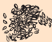
Britisk dyrket Hørfro