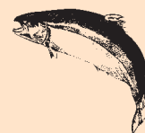
Skotsk Atlanterhavs Laks