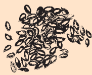
Britisk dyrket Høfrø