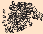
Britisk dyrket Hørfrø