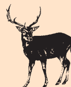
Red & Fallow Hjort